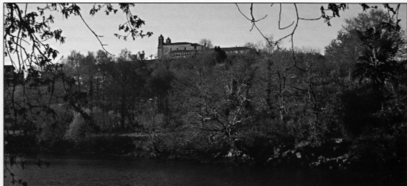
O Mosteiro de Lórcz dominando o río

O cenobio beneditino do Divino Salvador de Lórcz, situado na ribeira norte do curso baixo deste río comparte coa vila de Pontevedra boa parte da súa historia, o seu coto estendíase ata o arranque da ponte do Burgo e as súas terras alimentaban en boa medida aos veciños da vila. En concreto referímonos a un viña de mala calidade, denominado ullao en todo o arcebispado de Santiago, que tal vez deriva do río Ulla, viño que non era exportable e só valía para o consumo local. En Pontevedra entendíase que o viño ullao era o cultivado na contorna da vila, el vino que se cogiese devajo de la campana de San Bartolomé desta vila. Os seus rexentes gabábanse, a fins do século XVI da calidade destes viños: el vino ullano que en la dicha villa se cogía era el mejor que se cogía en toda el dicho arzobispado de Padrón allá . Mais a realidade era moi distinta e houbo que impor, como en outras partes, un consumo obrigatorio para dar saída a estes caldos de tan baixa calidade. Durante dous meses nas poboacións