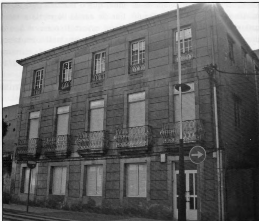
Antiga loxa no Burgo, posteriormente cuartel da Policía Armada

O feito deu lugar a numerosos comentarios e obrigou ao gobernador a facer pública unha nota oficial na que se afirmaba que facía dous meses que se tiñan novas das reunións "hecho que llamaba la atención por la significación política de quienes celebraban esas reuniones en un extremo de la población, periódicamente y de un modo tan cuidadosamente secreto" . Impuxo multas aos detidos e pasou o atestado ao xulgado de instrución que instruíu o sumario 88/30 por reunión clandestina e que acabaría sendo sobresido.