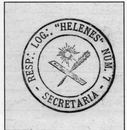
Cuño da loxa Helenes 7