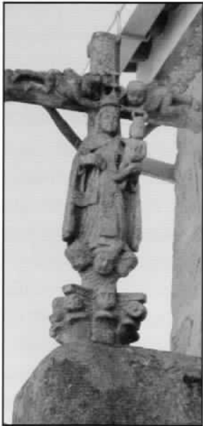
Santo. Virxe do Carne

O nome do Rosario ven dado porque, orixinalmente, estaba formado por unha restra de rosas brancas e vermellas que, máis tarde, converteríanse en bólas. Serven para contar as oracións nos rezos e foi entregado a santo Domingo pola Virxe no curso dunha aparición.