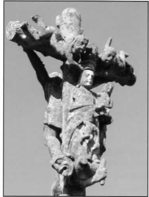
Tranca. Virxe do Socorro

Virxe do Socorro. - Está representada dun xeito practicamente idéntico nos cruceiros da Tranca e do Cemiterio, os dous do mesmo autor. O da Tranca presenta varios desperfectos faltándolle á Virxe o brazo dereito. Aparece coroada por anxos, sostén o Neno Xesús na man esquerda e empuña un pau ou tranca na man dereita (posiblemente sexa a orixe do nome popular do cruceiro) co que escorrenta o demo, que quere atraer a un meniño (as almas) que gabea polo manto da Virxe cara ao Neno Xesús (a salvación). Pertence esta advocación ao chamado "ciclo gozoso" da Virxe.