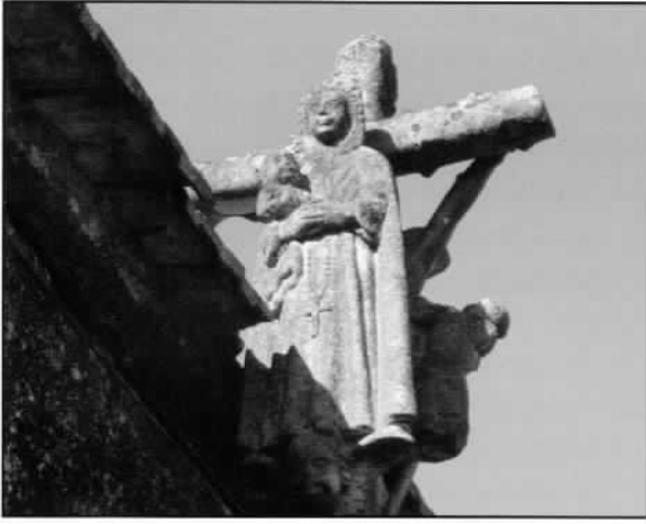
A Xicra. Virxe do Rosario.

O nome do Rosario ven dado porque, orixinalmente, estaba formado por unha restra de rosas brancas e vermellas que, máis tarde, converteríanse en bólas. Serven para contar as oracións nos rezos e foi entregado a santo Domingo pola Virxe no curso dunha aparición.