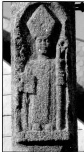
Casal Novo. Santiño

Os atributos son obxectos, reais ou convencionais, que serven para recoñecer e identificar as imaxes dos santos; non deben confundirse coas características pois estas sempre se refiren á aparencia física do santo ou santa.