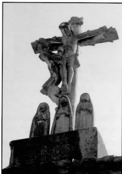
Cristo Benigno. As tres Marias

A identidade destas mulleres varía segundo as fontes; o evangelista Xoán escribe: “ Xunto á cruz estaba a súa nai e a irmá de súa nai, María, muller de Cleofás, e María Magdalena ”. En ocasións confúndense as identidades de María de Betania (irmá de Lázaro e Marta) con María Magdalena e a de María Salomé (muller de Zebedeo e nai de Santiago o Maior e Xoán) con María de Cleofás (irmá da Virxe).