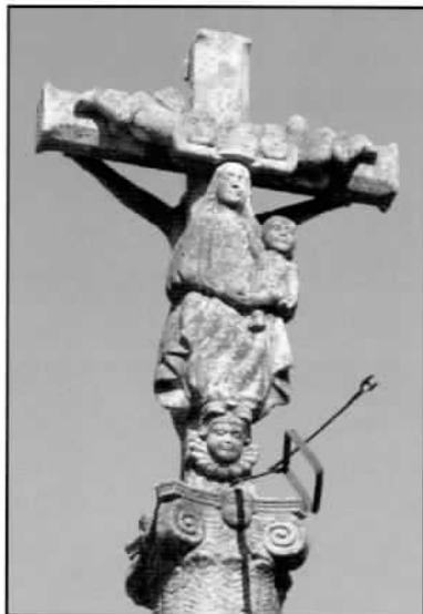
Casal Novo. Coroación

Coroación da Virxe. - No cruceiro de Casal Novo aparece de pé, apoiada nunha cabeza rodeada por unha orla que semella os raios do sol. Suxeita o Neno Xesús coa man esquerda e está coroada por dous anxos arrimados á cruz.