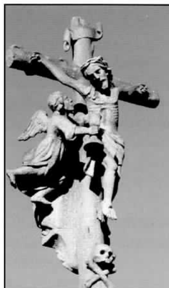
A Santiña. Un anxo recolle o sangue de Xesús

A recollida nun cáliz do sangue vertido por Cristo interprétase como a representación dos sacramentos da Eucaristía e do Bautismo, este sangue ten forza redentora e simboliza a vida da igrexa. Nos cruceiros da Santiña e de Paz é un anxo o que sostén o cáliz e no de Benigno realiza esa función un santo con hábito de franciscano. A ferida está no lado dereito (segundo san Agustín o lado da vida eterna) aínda que, ao esquecerse este simbolismo, podemos atopar cruceiros nos que aparece en ambos lados de xeito indistinto.