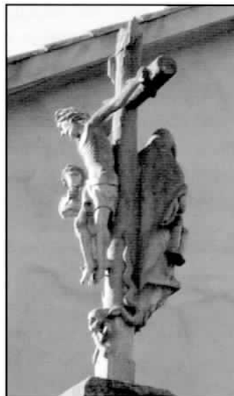
A Santiña. Serpe

Reforza esta relación a presenza da serpe (cruceiros da Santiña e de Paz). Aínda que a serpe foi considerada como símbolo de inmortalidade (pola muda da súa pel) ou mesmo de prudencia, a crenza máis estendida é a que a asocia á figura do demo; sería un animal maléfico e astuto utilizado por este para enganar ao home. No relato bíblico aparece tentando a Adán e Eva para que cometan o primeiro pecado e perdan a inmortalidade.