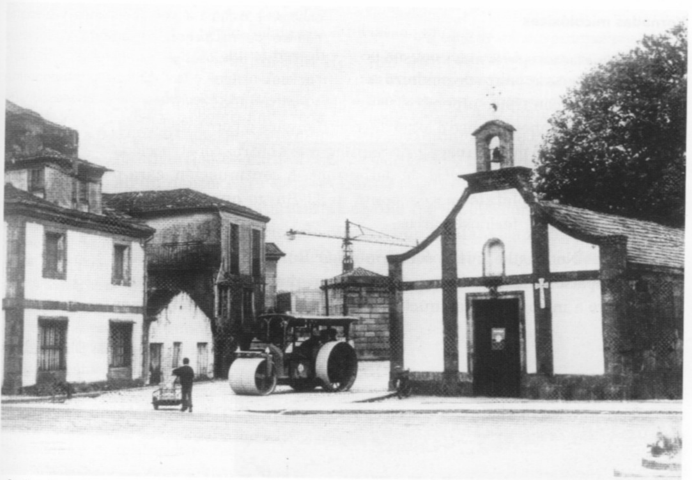
Santiaguíño do Burgo. Medios dos anos 60. (Actual rúa Xoan Manuel Pintos)

O Pai Sarmiento, que viviu en Pontevedra e estudou no seminario do mosteiro bieito, louvou sempre que tivo ocasión as terras de Lérez e O Burgo, sobre todo nos escritos arredor das viaxes que fixo a Santiago, sinalando lugares, carácter de persoas e traballos máis usuais naquel tempo, dando moitas notas que son, aínda hoxe, importantes para o coñecemento dos devanditos espazos. Louvanzas comentadas por moitas das persoas que recorrían o camiño portugués e tanto como a raiña Isabel e don Denis de Portugal, o conde don Enrique, Pedro Madruga, Tomás Becket ou Baldi foron algúns dos que recoñeceron estas terras como lugares de fermosura e xenerosidade, que os veciños souberon gardar ata hoxe en día.