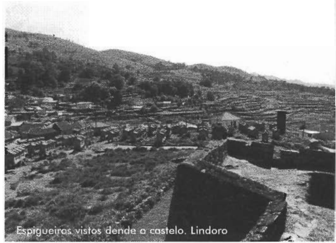
Espigueiros vistos dende o castelo. Lindoso

estrutura moi variable e a máis corrente consistía en: