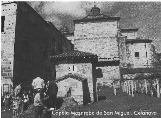
Capela Mozárabe de San Miguel. Celanova