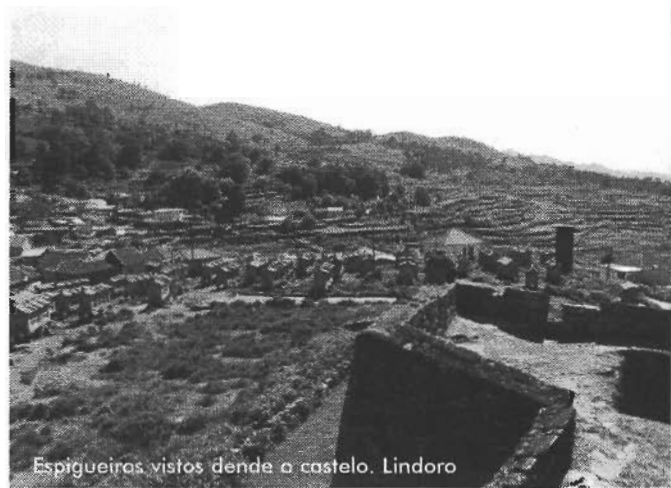
Espigueiros vistos dende o castelo. Lindoso

estrutura moi variable e a máis corrente consistía en: