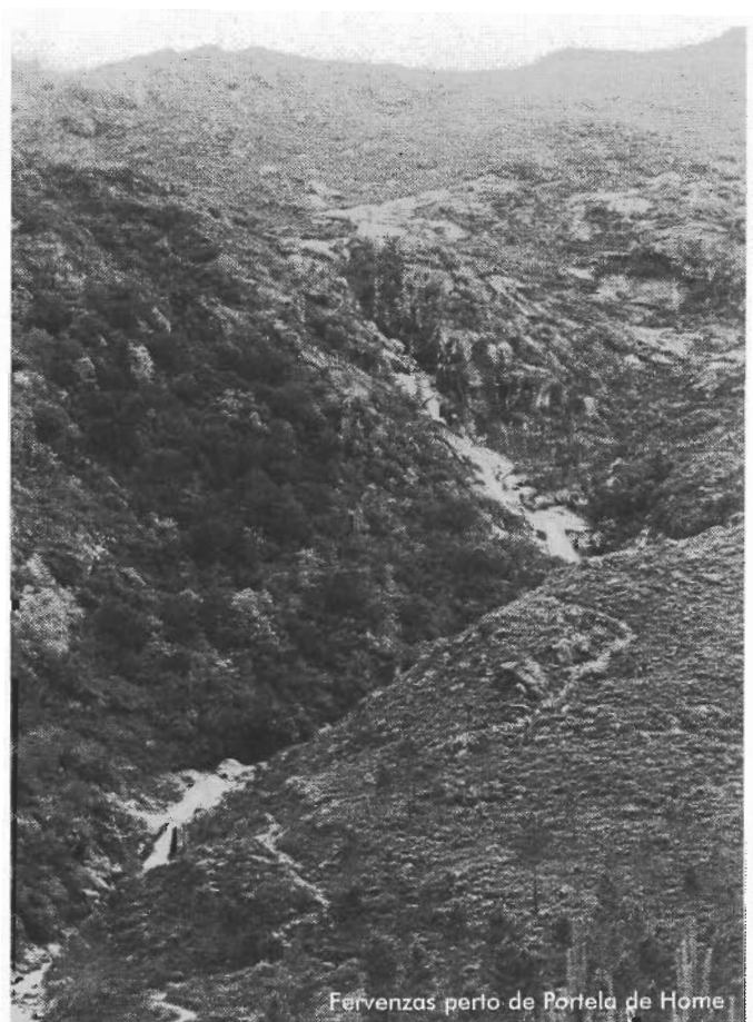
Fervenzas perto de Portela de Home

Despois de atravesar (nunca mellor dito) o mercado de Entrimo, encamiñámonos cara a Portela de Home. Por este lugar entraba en Galicia a vía XVIII do Itinerario de Antonino (compilación das rotas principais do Imperio Romano e no que, á parte da lonxitude, enumera as mansións do percorrido), tamén chamada Vía Nova, e que comunicaba polo interior Braga con Astorga. Existe unha reconstrución dun tramo da mesma e un conxunto de miliarios á súa beira. As calzadas romanas tiñan unha es-