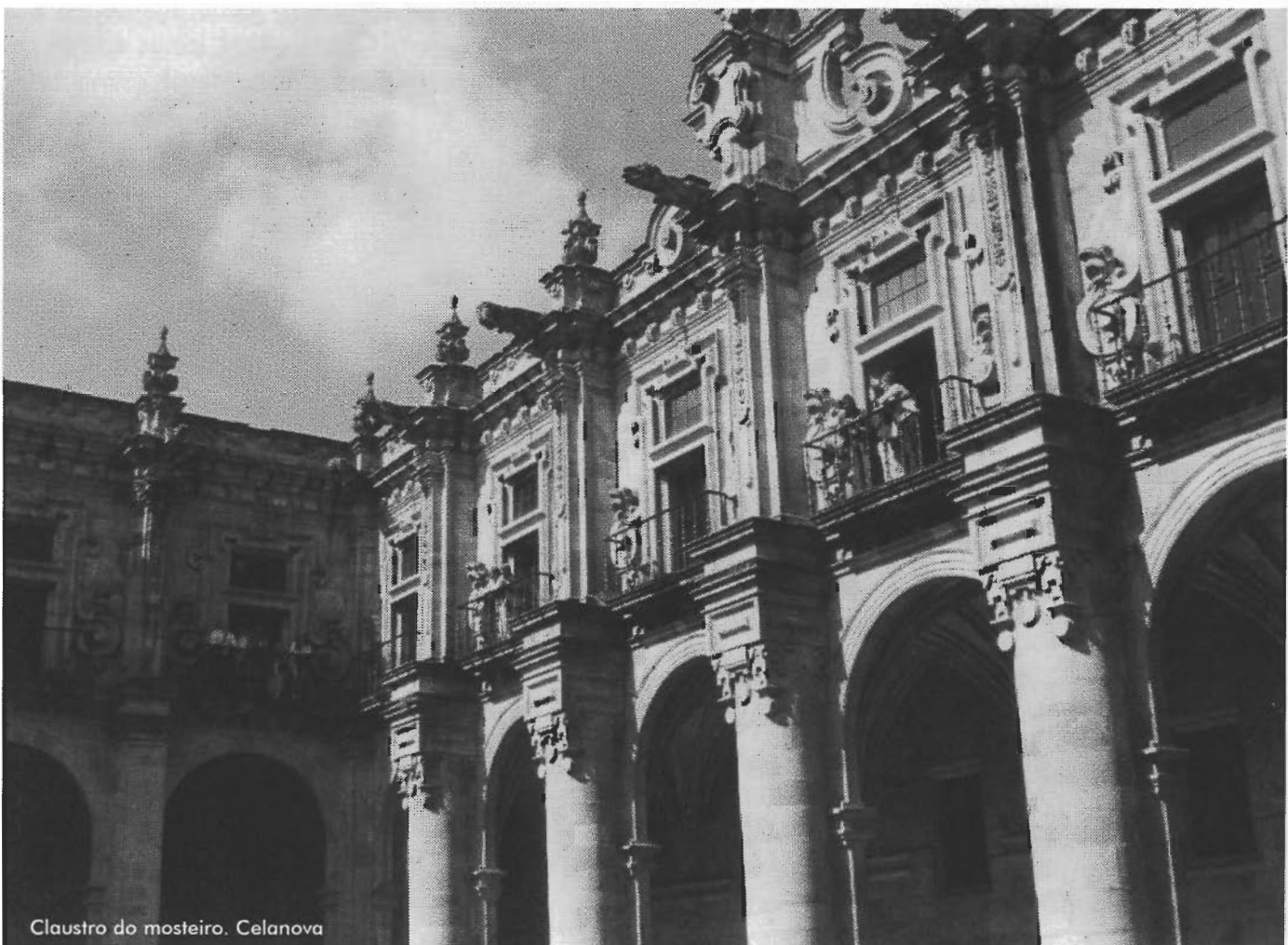
Claustro do mosteiro. Celanova

Xa pola tarde entramos en Portugal e dirixímonos a Lindoso. Este pequeno pobo está situado á beira da estrada que vai cara á ponte da Barca. Posúe un castelo ben conservado cun pequeno museo no que chama a atención un forno de pan de grandes dimensións. Ó seu lado hai un dos conxuntos de "espigueiros" (hórreos) máis interesantes