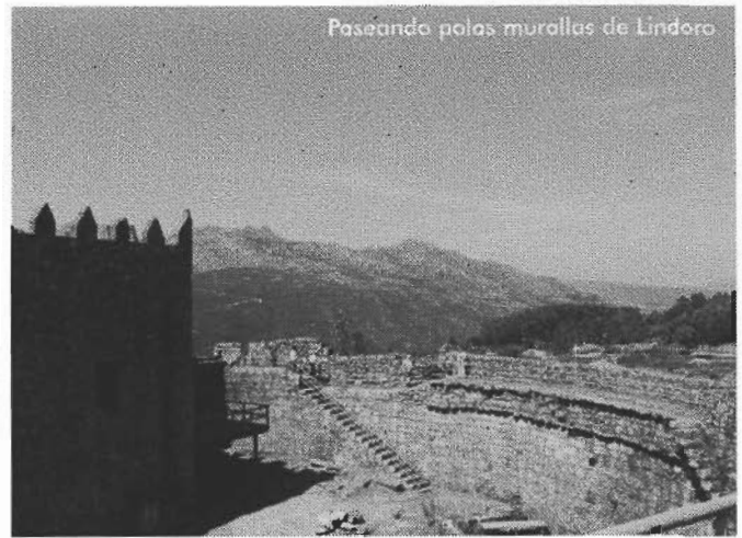
Paseando polas murallas de Lindoro

O próximo destino foi a igrexa prerrománica de Santa Comba de Bande. É orixinaria do século VII, sufrindo posteriormente varias reformas. Ten planta de cruz grega, saíndo dun dos seus brazos un ábside cadrado que nos lembra modelos da Asia Menor.