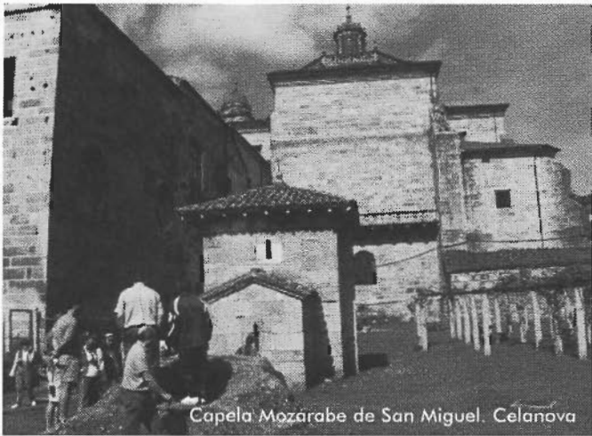
Capela Mozárabe de San Miguel. Celanova