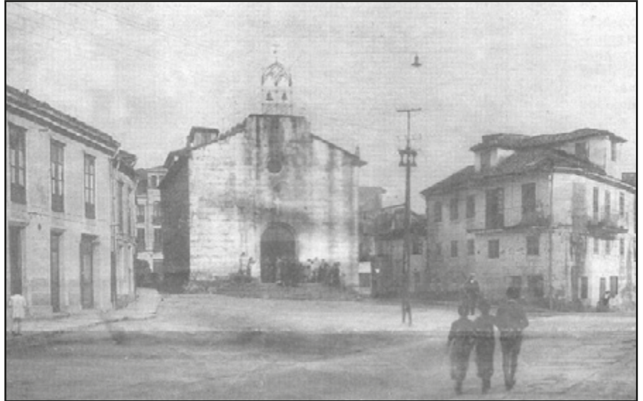
Praza de Compostela- Frai Juan de Navarrete. Igrexa da Virxe do Camiño.

Desta capela e da súa Virxe, nin unha placa daba nin deu pé á súa lembranza. Mais aínda así, non só quedou dela a súa memoria. A carón seu, lucira ata hai ben pouco, unha fermosa e grande casa de arquitectura popular con