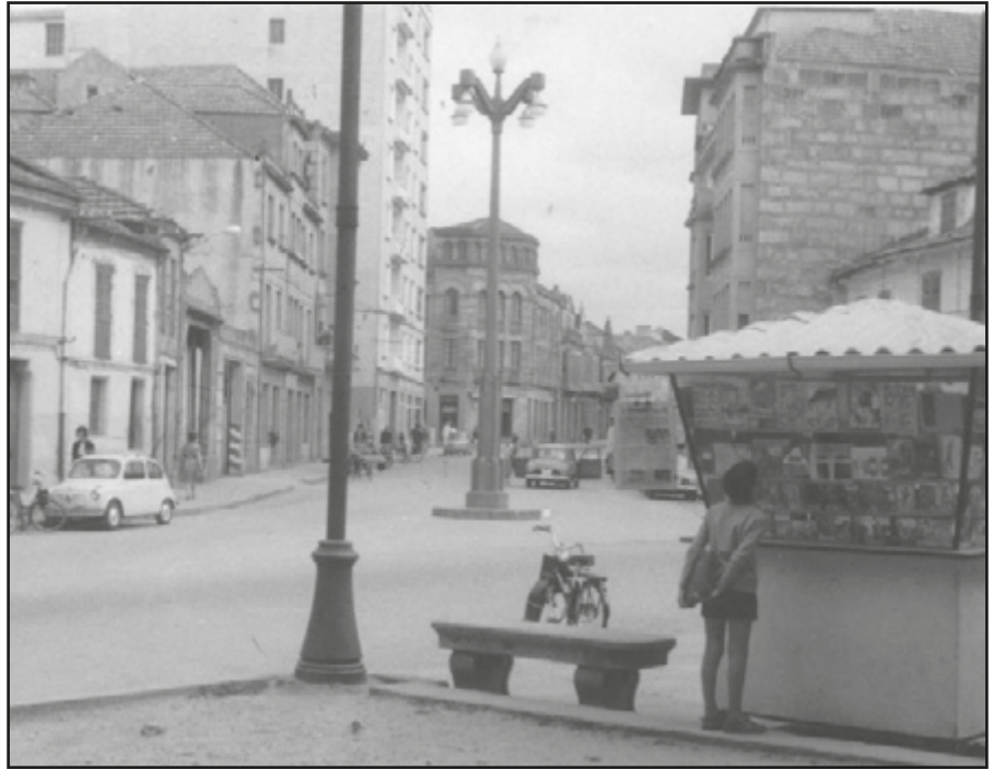
Praza de Compostela.- Frai Juan de Navarret

Temos logo na nosa cidade unha Virxe do Camiño con hospital incluído, coa súa denominación propia, subscrita dende a pródiga actividade do Camiño portugués ao longo de moitos séculos, e unha Virxe 'da' Peregrina. No acreditado daquela primeira veneración do camiño portugués, adscríbese ademais a veneración por San Roque, santo tamén vinculado ás peregrinacións e que colleu gran devoción en Galiza coa epidemia da peste do século XVI. Pois ben, como a nosa, hai moitas Virxes do Camiño dispersas pola xeografía galega, e todas relacionadas co itinerario xacobeo, e tan ben acompañadas, algunhas con hospital, e a de Santiago incluso cunha biblioteca, que constaba como a de ser das máis antigas de España. O que queda en evidencia é que en Galicia a todas as veneracións viaxeiras chamáronlle así. E de entre todas a única que sufriu un ninguneo histórico, ata a súa desaparición, foi a de Pontevedra.