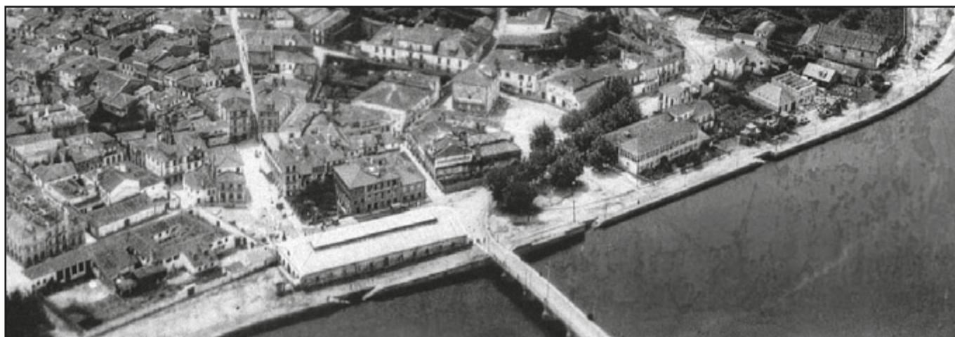
Detalle da foto aérea de Pontevedra, 1928 (catálogo Entre dúas augas)