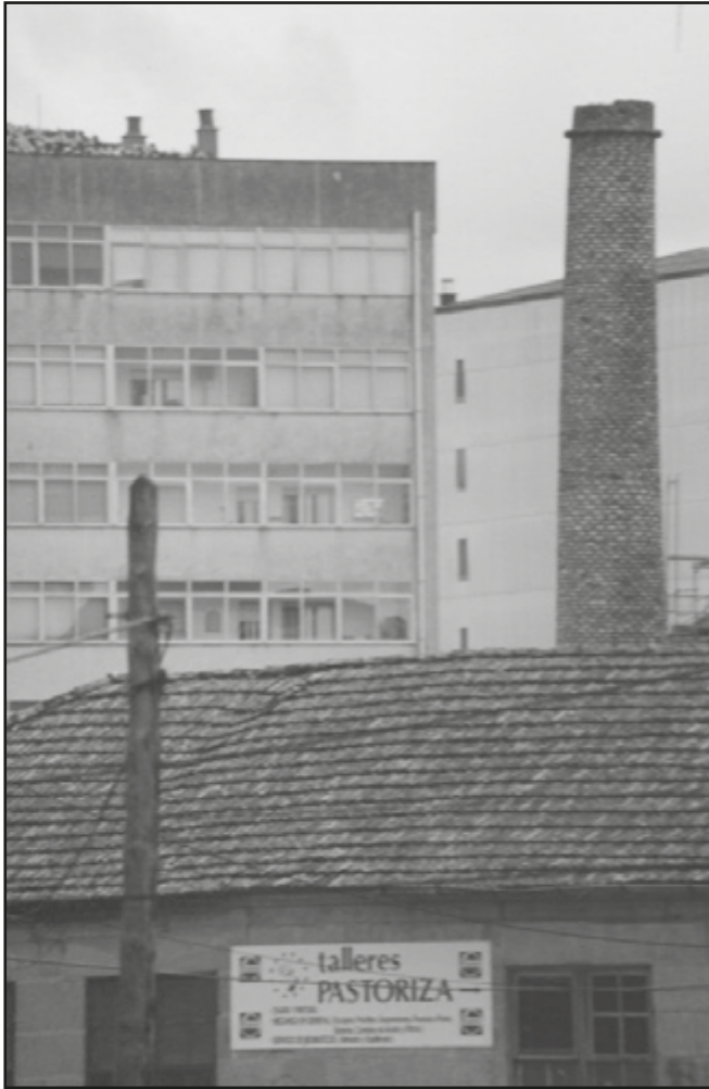
Instalacións (agora desaparecidas) dun curtidoiro en Ponte Bolera, Pontevedra, reconvertido en Talleres Pastoriza (Chimeneas Industriales, Pontevedra...páx. 12)