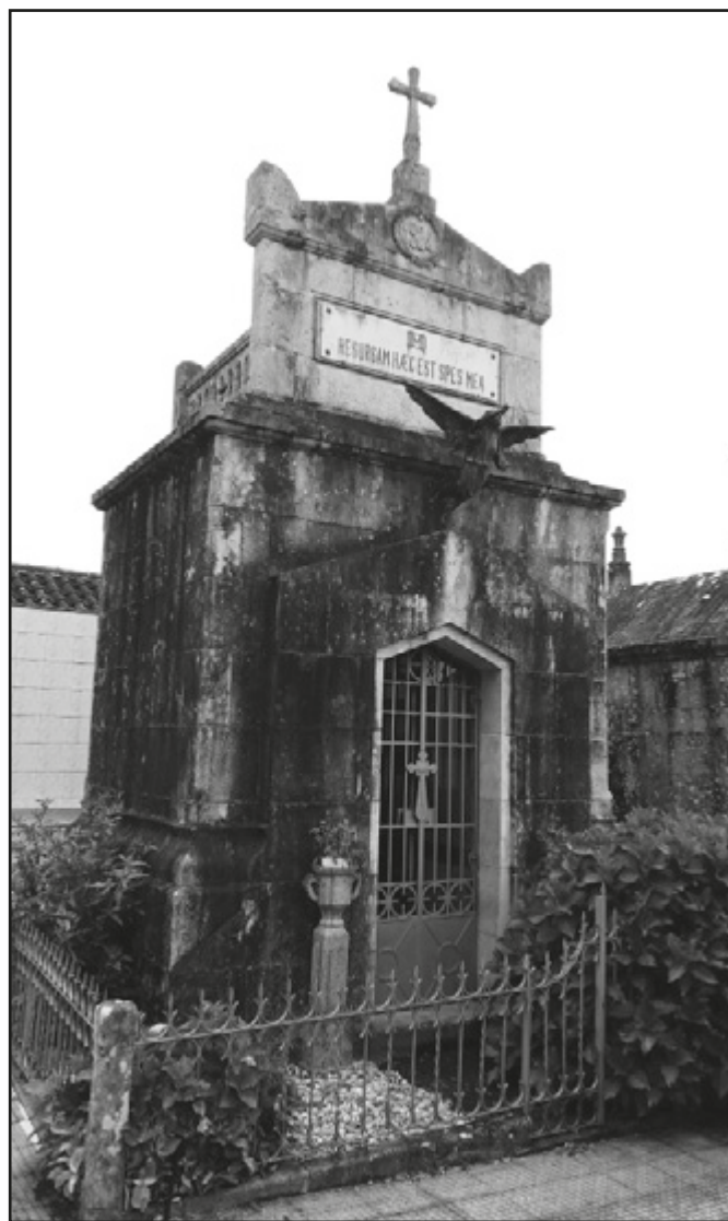
Panteón con anxo trompeteiro

Entrando no cemiterio a poucos metros e a man esquerda atopámonos cun dos máis destacados panteóns do lugar. Posúe planta rectangular coa fachada levemente adiantada e con remate triangular en cuxo vértice destaca a escultura dun anxo trompeteiro. Simboliza ao arcanxo san Gabriel, encargado de anunciar o día do xuízo final. Por isto, represéntaselle coa trompeta para chamar á resurrección. Na actualidade esta escultura carece do instrumento musical que aínda mostraba non hai moito tempo. Tras unha leve cornixa que percorre o perímetro da construción