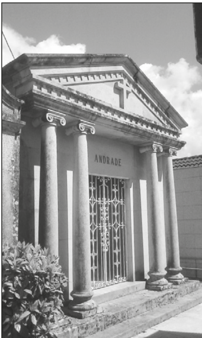
Panteón da familia Andrade