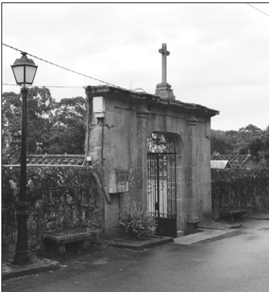
Entrada do cemiterio parroquial de Lérez