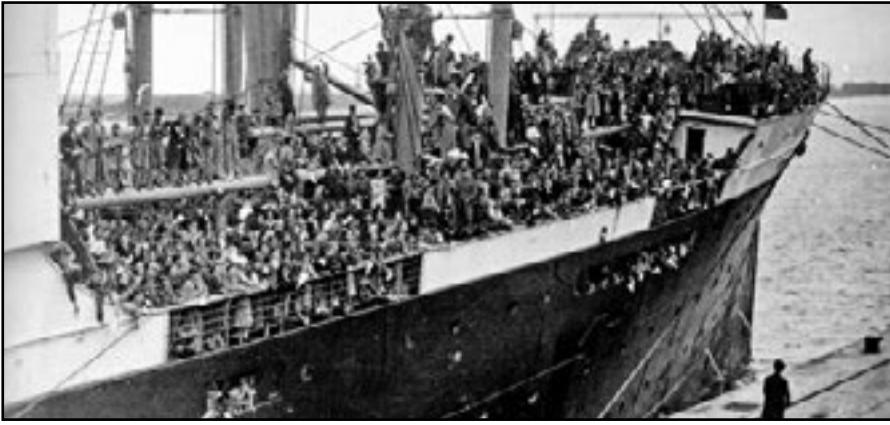
Deriguerina (El Musel 23 9 1937)

autoridades da República 10 aranzaron con países como Unión Soviética, Inglaterra, Francia, Bélxica, México, etc. a evacuación de menores de idade para “evitarlles os rigores da guerra” coa crenza xeneralizada de que sería algo temporal, como moito uns meses ata que se resolvera o conflito que a causaba.