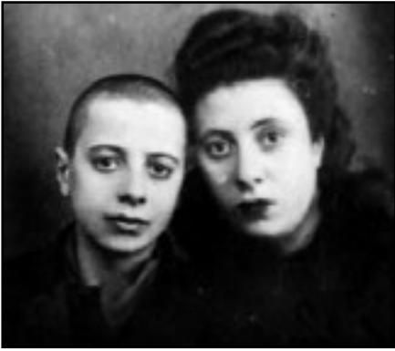
Rusia: Amigas de Carmen Libertad

outra no Batallón Amantegui e por último no Batallón Baracaldo no que, segundo se cre, nun dos bombardeos un artefacto explosivo impactoulle e morreu sen deixar rastro algún.