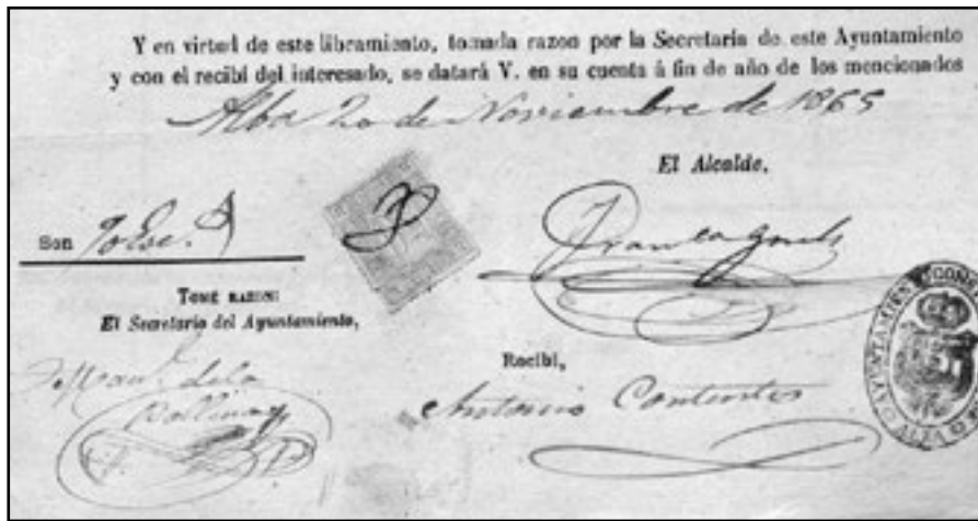
Sinaturas en documento. ATOPO. Arquivo Deputación Provincial de Pontevedra.

Os orzamentos e as xustificacións de contas son uns dos máis axeitados medios para coñecer a vida de calquera institución; neste caso utilizarémolos para achegarnos á historia do antigo concello de Alba do que formou parte a nosa parroquia. Como método de traballo fixemos unha análise de 16 exercicios fiscais, comprendidos entre o ano 1843 e o 1866-67, depositados no arquivo da Deputación pontevedresa. Correspóndense cos remitidos ao xefe político da provincia, que era o encargado de examinalos e darlle aprobación ou devolvelos cos reparos correspondentes.