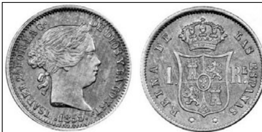
Moeda de real da época de Isabel II.

Como podemos apreciar no relatado anteriormente, os orzamentos deste concello estaban moi limitados a uns escasos ingresos; por outra banda os gastos tampouco eran moi elevados pero, en ocasións, as imposicións alleas para maior fausto e boato da monarquía borbónica supuxeron unha porcentaxe significativa do total orzamentario.