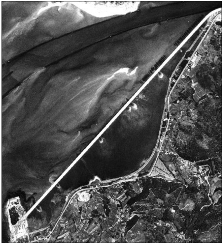
Vista aérea da zona que logo será ocupada por CELULOSAS. Foto 1956

Outro aspecto a ter en conta respecto da súa situación xusto á beira ría era o tocante á eliminación do refugallo. Os fluxos das mareas ían facer un “traballo” moi inestimábel.