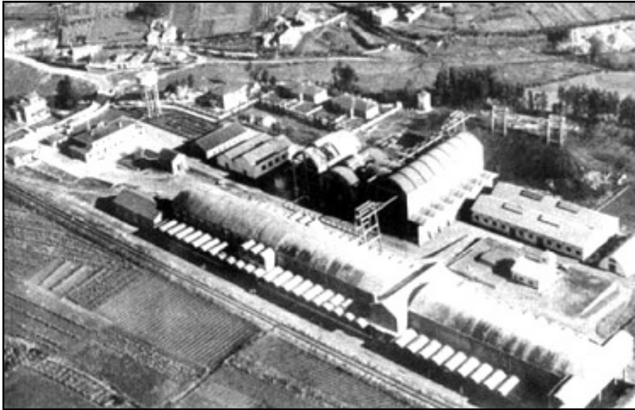
Vista da factoría de S. A. CROS na época do seu apoxeo produtivo.

factoría funcionou como secundaria ou ampliación da instalada a carón da ría do Burgo (Culleredo) preto da Coruña en 1932