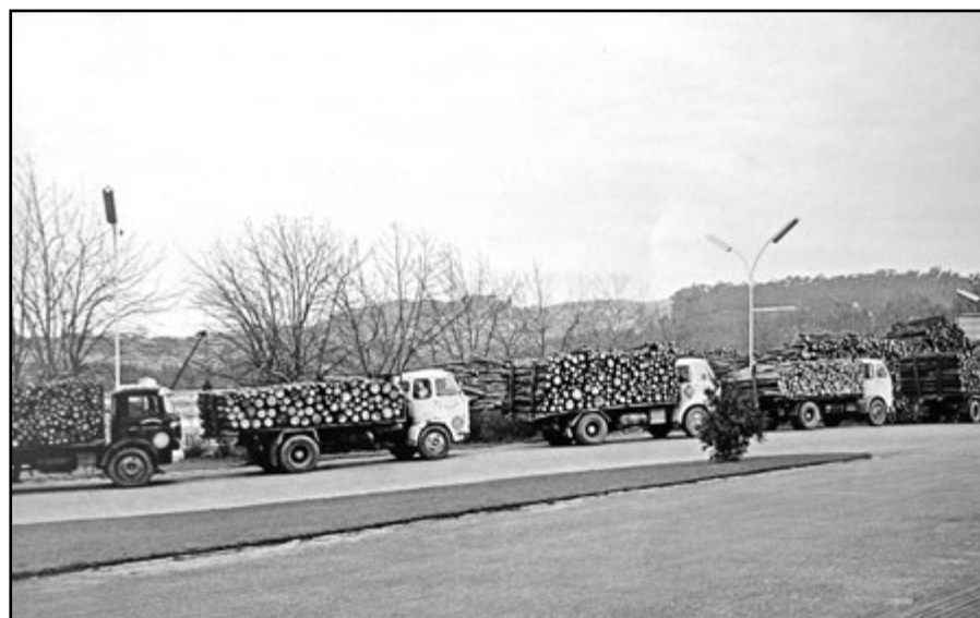
Camións en TAFISA agardando turno para descargar.

A dirección da fábrica tiña o costume de que cando nacía un fillo dun traballador abrírlle unha cartilla bancaria cunha cantidade de diñeiro.