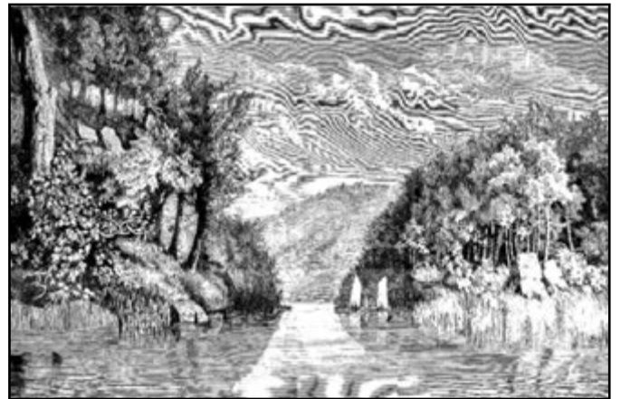
“Perspectiva del río Lérez” de Guisasaola

serpe de cristal. As ribeiras son altas e sementadas de piñeiros, tan altas, que só ás doce do día, na que os raios do sol caen a verticais sobre a terra, non se atopa sombra deliciosa ao remontar a súa clara corrente; porque esta é tan clara e tan limpa, que case se transparenta seu fondo de finísima area. [...] Antes de chegar á fervenza, cuxos arredores son do máis pintoresco que imaxinarse pode, pásase por illote baixo, onde nos apeamos e seguimos a pé, arrastrando a barca para amenizar a excursión.