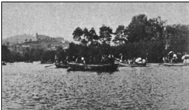
Paseo polo Lérez.