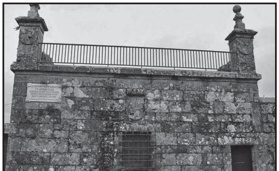
Fachada oeste cun escudo sobre a fiestra

a finais do século XIX por iniciativa da Sociedade Arqueolóxica de Pontevedra. Na referida placa pode lerse: