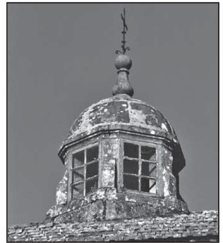
Lanterna da capella de San Bieito

por iso, debía ser un dos edificios sobranceiros dos mosteiros.