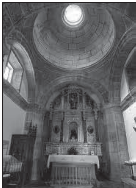
Capela de San Bieito

No referente á cronoloxía, observamos que no lintel da porta que comunica co exterior pódese ler -AÑO 1700-, o que nos indica que por aquel entón a capela estaba en obras. Daquela, é posible que estas comezasen na segunda metade do século XVII e rematase o groso delas a comezos da centuria seguinte, probablemente antes de comezar as obras da actual igrexa. Con todo, sendo abade Ysidoro Estévez (1781-1785) Se enlosó de piedra de cantería toda la capilla de Nuestro Padre San Benito, haciendo en ella las sepulturas para el entierro de los monges. 25 Efectivamente, aínda hoxe se poden ver as tampas dos enterramentos como a do Padre Beda ao pé do altar. 26