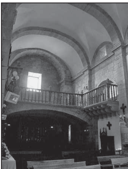
Coro alto aos pés da igrexa. Nótense os arcos faixóns e as pilastras que os sustentan

ZARAGOZA Y PASCUAL, E. "Abadologio del monasterio de Léz (siglos XVI-XIX) En "El Museo de Pontevedra" nº 48. 1994.