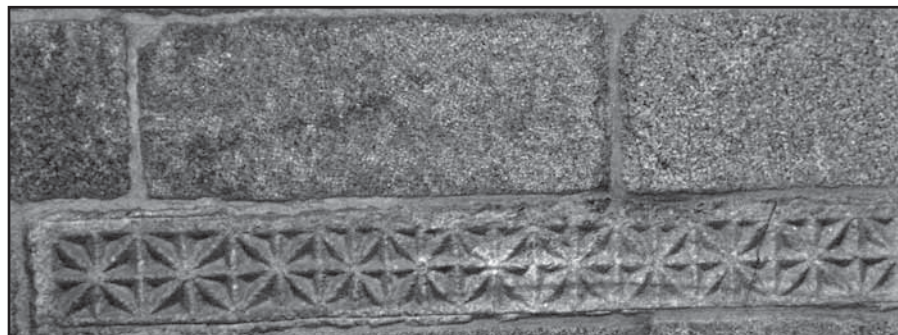
Perpiaño reutilizado no muro sur da igrexa