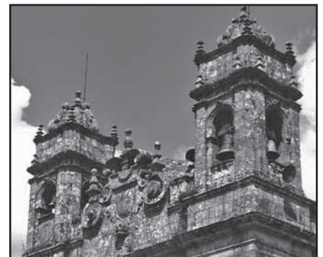
As torres e o frontón forman a parte máis plástica da fachada

Nas grandes pilastras do arco de triunfo que separa o presbiterio do resto da nave atopamos placas verticais que rematan en formas