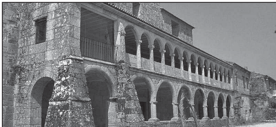
Arcada do claustro que se conserva

Tras a súa fundación, o mosteiro de Lérez coñeceu séculos de observancia e prosperidade, pero chegado o século XIV, entrou en decadencia por diversas razóns, entre as que cabe citar o incumprimento da regra beneditina ( ora et labora ) por parte dos frades, a mala administración e os abusos dos abades comendatarios 10 . O resultado conduciu á degradación da vida conventual, á crise económica e ao deterioro dos edificios monacais. Houbo que esperar a 1540, ano da incorporación do noso mosteiro á Congregación de Valladolid 11 , para iniciar un proceso de recuperación da observancia, de reorganización do patrimonio e de administración eficiente que levarían á superación paulatina da crise económica. A mellora da economía permitiría comezar unha serie de obras imprescindibles, promovidas pola autoridade central, encamiñadas a facilitar a volta á disciplina conventual, a atender as necesidades derivadas do incremento do número de membros da comunidade 12 e a engrandecer o seu poderío. Con todo, a recuperación foi lenta, pois o abade reformado, Pedro Ortiz (1543-1549), fixo un novo dormitorio dos monxes (primeiras obra,