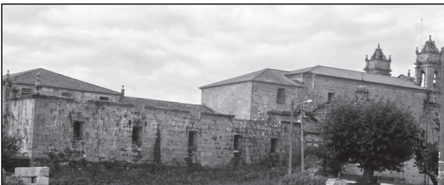
Vista do mosteiro de Lérez