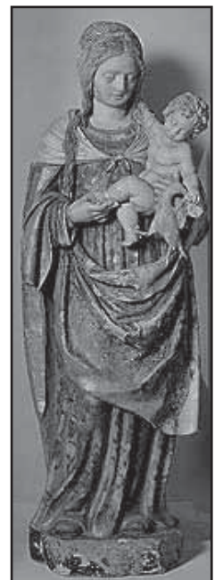
A Virxe Branca