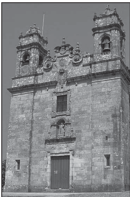
Fachada da igrexa de Léz

forman, o conxunto máis plástico e orixinal da fachada. Son de planta cadrada e na parte superior presentan dous corpos. O primeiro con fiestras rematadas en arcos de medio punto e pináculos nas esquinas e o segundo, máis baixo, tamén con pináculos nas esquinas, remata nun casquete dividido por catro resaltes con volutas e coroado por un pináculo.