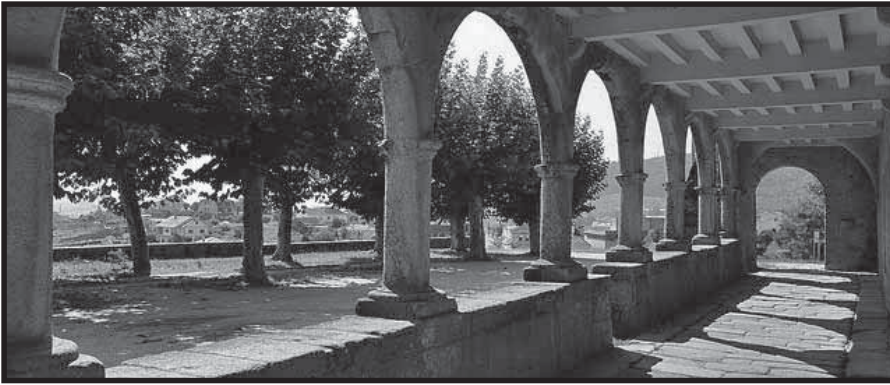
Arcada do claustro, parte inferior

Na parede da igrexa a carón do extremo oeste desta arcada vense as pegadas sobre as que arrincaría a arcada perpendicular e, no outro extremo consérvase o arranque da arcada do costado oriental.