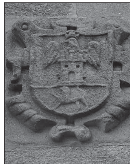
Labra dos Enríquez de Novoa

O seguinte escudo está situado no mesmo muro da rúa Princesa que o anterior. Seguramente foi labrado para figurar nese muro do pazo, así como os outros 5, aínda que están relacionados intimamente con esta familia, tamén puideron vir doutras vivendas da cidade.