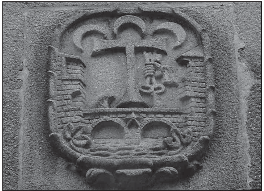
Labra dos Gagos