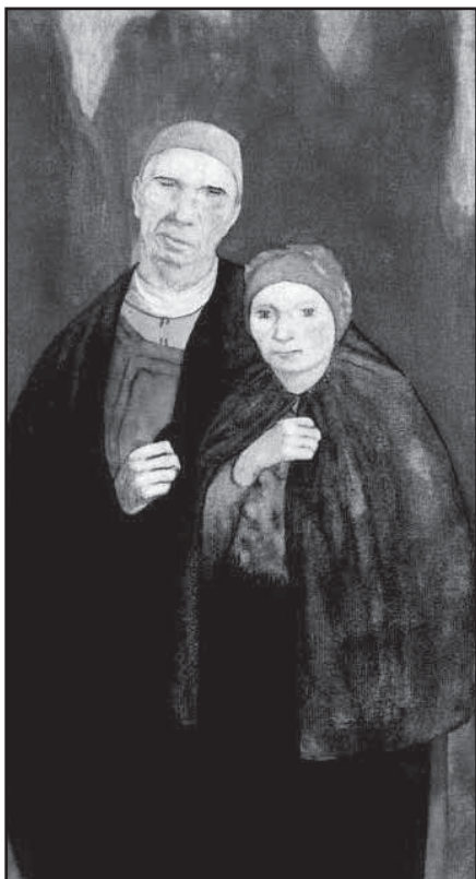
Alfonso Rodríguez Castelao (1886-1929) Cego e Filla . 1922-1929 Augada Sobre Papel Museo de Pontevedra