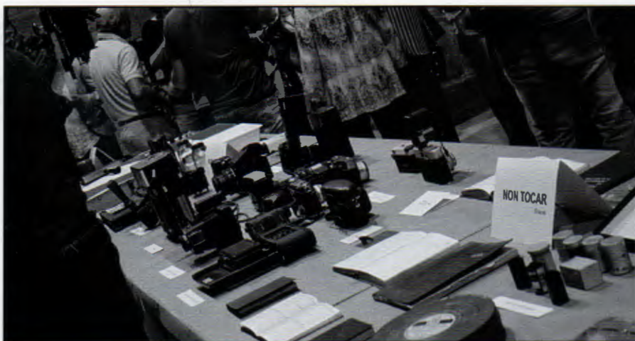
Cámaras e outro material exposto

Nesta época, os servizos de Rodri tamén foron solicitados polo Goberno Militar para facer reportaxes de diversa índole. Como exemplo deste traballo, Rodri escolleu para esta exposición varias fotografías dos actos conmemorativos do XXV aniversario da BRILAT, instalada en Figueirido.