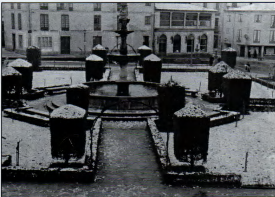
Nevarada na Ferrería, 1963

Por diversas razóns, a fotografía de estudo foi minorando a demanda, polo que Rodri axiña comezou a realizar reportaxes de vodas e bautizos, modalidades daquela en auxe, que, como se dixo, xa explorara anteriormente. Foi, sen dúbida, unha actividade de gran éxito, se cadra,