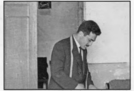
Pechecho na súa xastrería

- Tiñamos medo porque sabíamos que aquelas descargas significaban a morte de xente inocente.