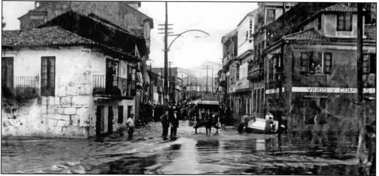
Despois da tormenta. Barrio do Burgo