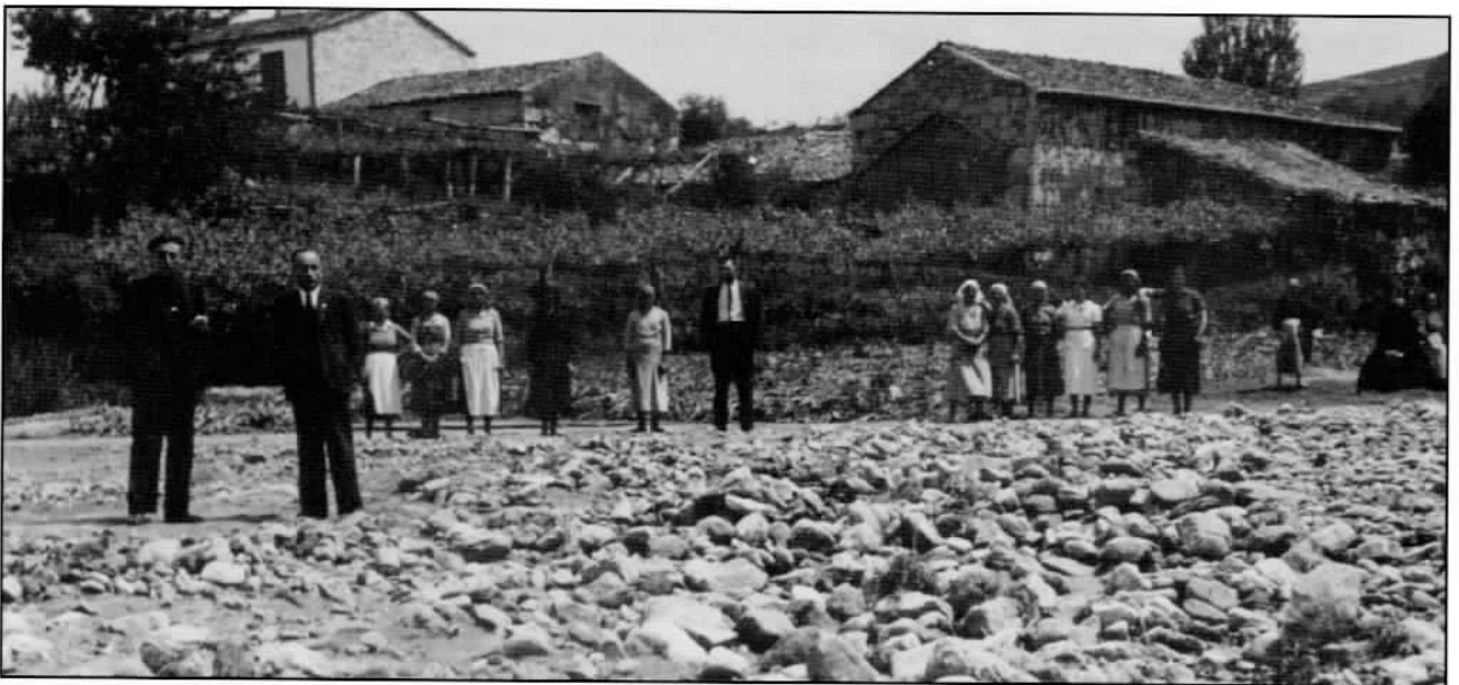
As xentes do rural ollando a desfeita

O día 12 de outubro, Casares Quiroga, aproveitando a reunión do Partido Republicano Galego, infórmalles aos catro gobernadores civís de Galicia que o seu ministerio acordou conceder 300.000 pta Para paliar os danos causados polo mencionado temporal. Pero esta cantidade non viña só para a provincia de Pontevedra, senón que ía