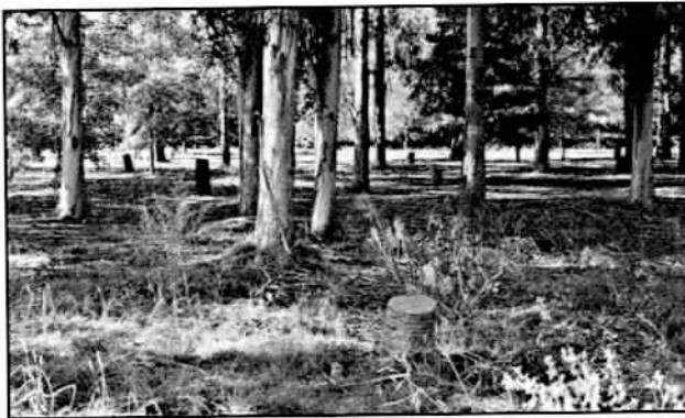
Aspecto do eucaliptal.

Nese eucaliptal das esculturas viven esperando mellores condicións de vida 7 tileiros americanos ( Tilia americana ), 2 tileiros de follas grande ou tileira ( Tilia platyphyllos ), 8 tileiros prateados ( Tilia tomentosa ), 2 castiñeiros ( Castanea x coudercii ) e a maioría dos 17 liquidámbares ( Liquidambar styraciflua ) coas súas follas en forma de estrela de cinco puntas que en outono vai collendo un colorido que pasa do verde ao vermello escuro percorrendo toda unha gama de amarelos, ocre e laranxas espectaculares e 16 árbores das tulipas ( Liriodendrum tulipifera ) espalladas pola illa, os accesos á mesma e o antigo parque da familia, coas características follas truncadas e as flores que parecen tulipas, de momento aínda son novos para dar flores.