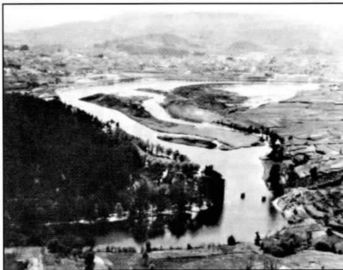
A Xunqueira a finais da década de 1950

Na foto do arquivo de Cedofeita (dalgunha colección de postais de principios do s. XX) pódese apreciar esa forma de cunca que puido ser a orixe do topónimo Covo, e tamén a extensión das marismas ou secas ás que me refiro.