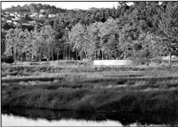
Zona de xunqueira co labirinto de Robert Morris

Nunha destas zonas está a escultura de Robert Morris "Laberinto de Pontevedra" feito en granito cuberto de lousa ("pizarra").