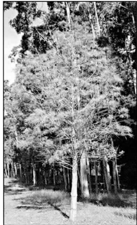
do alcipreste calvo en outono, antes de caer a folla.

("pizarra") verde de Lugo, colgadas en tres eucaliptos que mira por onde salvaron a vida, o mesmo que seguen en pé os eucaliptos que rodean aos "36 justos", pois aínda que algúns teñen unha marca vermella, sospeitosa, supoño que lles pararon a corta por se as esculturas sufrían "daños colaterales". Asunto que debeu sufrir o alcipreste calvo ( Taxodium distichum ) que estaba moi ben situado polo tema da humidade do solo, pois esta árbore procedente do Mississippi é de río, vivindo incluso asolagada producindo entón unhas curiosas raíces respiratorias, que no caso das plantadas en Pontevedra non se dan, por estar en solo seco.