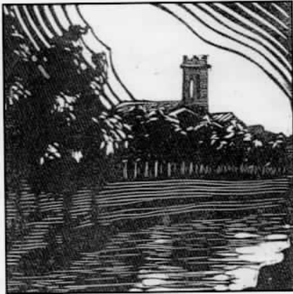
Recreación da torre de Cedofeita, por Paisa.

La resistencia de Pontevedra al ataque del portugués se apoyó en sus fosos, barbacanas, muros y torres; de estas fortificaciones tenemos noticias precisas por multitud de documentos que en gran parte y en extracto publicó la Sociedad Arqueológica, así como por los recuerdos de los vecinos ancianos que alcanzaron a ver casi completas las expresadas murallas y torres, y también por los restos existentes, alguno de los cuales non ha sido estudiado y revela á nuestro juicio haberse construido en época remota; quizás sea la única reliquia que nos queda de la antigua ciudad de Lambriaca" (p.184-5).