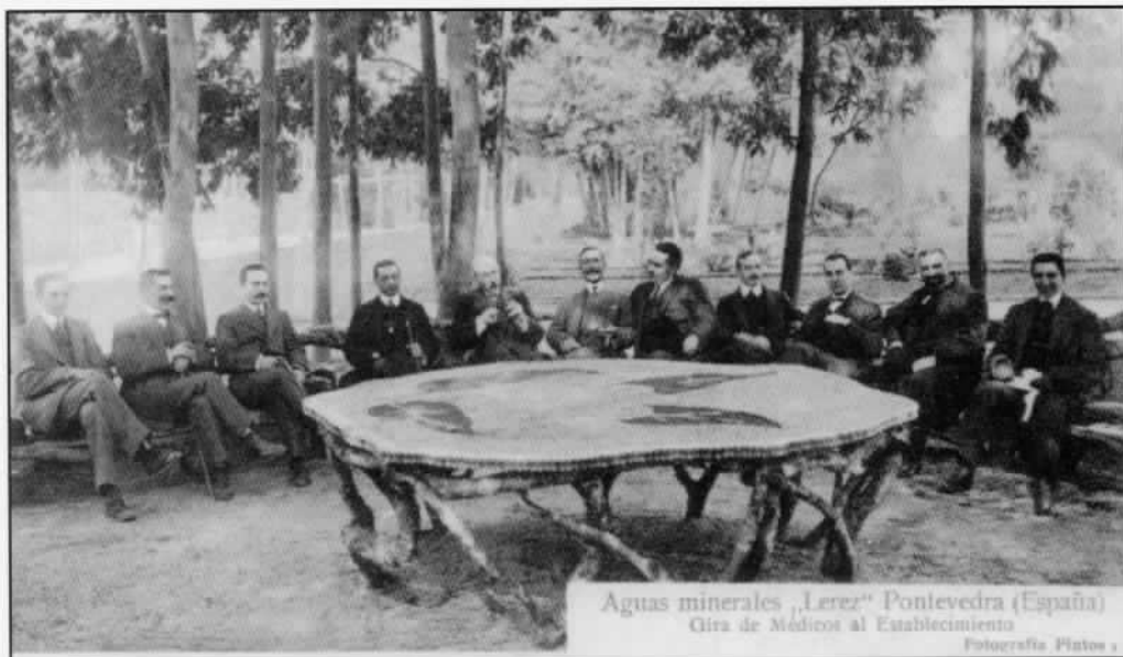
Aguas minerales "Lerez" Pontevedra (España) Gira de Médicos al Establecimiento

Un dos eixos rectores da estratexia de Casimiro Gómez consistiu en conseguir dun elevado número de profesionais da medicina, científicos e personalidades, unha serie de informes favorables sobre os efectos terapéuticos e calidade das Aguas Minero-Medicinales "Lerez" . No caso dos pertencentes aos dous primeiros grupos, na súa práctica totalidade foron arxentinos e españois. No apartado de personalidades, atopamos a políticos ligados a Pontevedra, xunto co dramaturgo Echegaray.