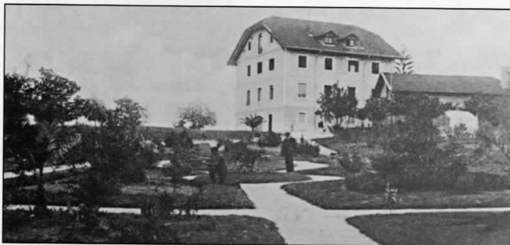
Vivenda e parque "Villa Buenos Aires". J. Pintos 1908

actuando agora, fundamentalmente, como granxa experimental. No Concurso de Gando organizado pola Deputación de Pontevedra o 1 de novembro de 1925, o indiano de Viascón obtén as primeiras recompensas aos cambios introducidos na súa propiedade pontevedresa, sendo indiscutible o triunfo da Granxa Monte Porreiro. Ao ano seguinte, no contexto dunha óptima participación galega, os porcos da Granxa Monte Porreiro presentados na Exposición Nacional de Gandos , celebrada no mes de maio en Madrid, son os que conseguen unha intervención máis destacada ao obter o Primeiro Premio .