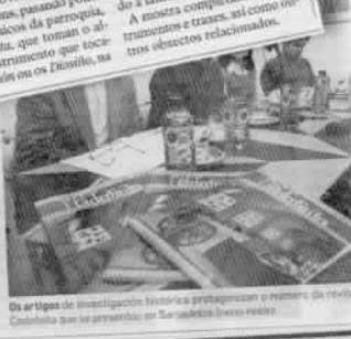
Os artigos de investigación histórica e etnográfica do número da revista Cedofeita que se presenta en San Bieito (Lérez).