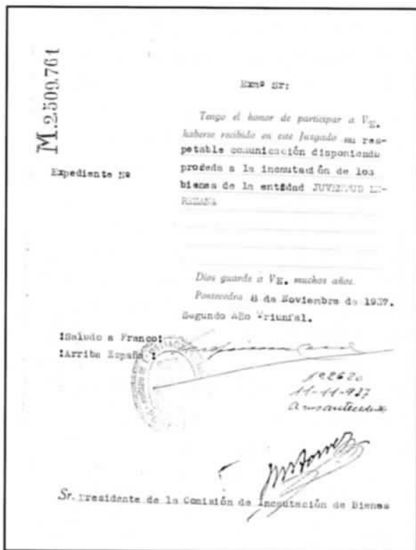
Un dos documentos da incautación

O levantamento militar de xullo do 36 remata con esta e con outras iniciativas dos veciños de Lerez. Iníciase o proceso de incautación de bens das sociedades cualificadas de "marxistas" e a esta entidade tamén a inclúen nas mesmas. Un informe do alcalde pontevedrés Ernesto Baltar Santaló, datado o 27-9-37 (II Año Triunfal) fai unha serie de consideracións sobre distintas sociedades de agricultores acusándoas de extremistas e xa máis especificamente sobre Juventud Lerezana, cualificaa de juventudes marxistas e acusa aos seus dirixentes de ser comunistas e socialistas. É certo que varios dirixentes simpaticizaban con organizacións de esquerdas e esa era a orientación xeral deste tipo de entidades culturais, pero tamén o é que outros compoñentes destacados da mesma estiveron fortemente comprometidos co bando franquista e como membros activos das súas organizacións.