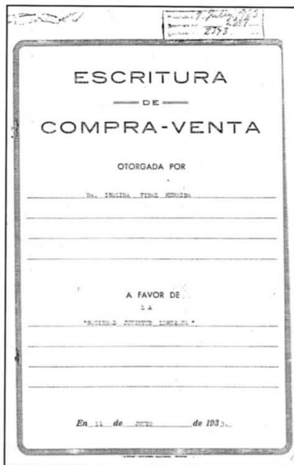
Escritura de compra de terreos para o edificio