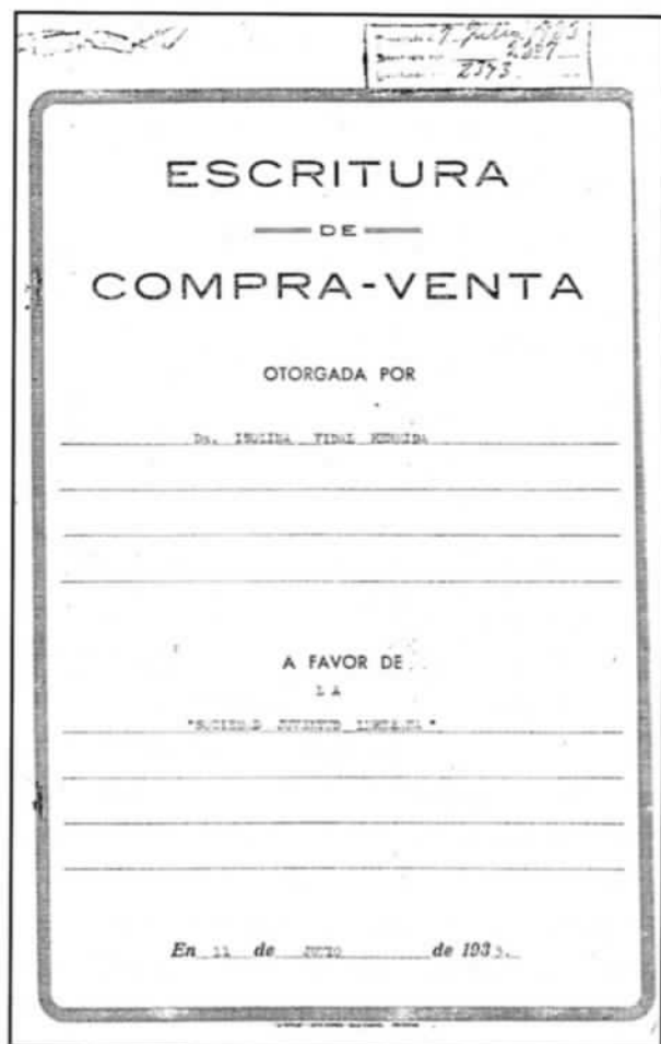
Escritura de compra de terreos para o edificio