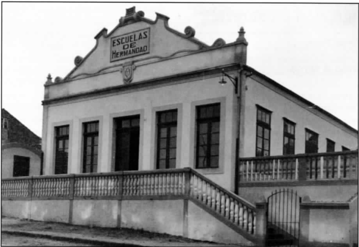
Local social de Juventud Lerezana

registros de propiedade de bens inmobles pertencentes a entidades de acordo co decreto-lei 10-1-37 e disposición de incautación que se remiten á dirección xeral de propiedades, figura no nº 19 a entidade Juventud Lerezana. 14 Remata o expediente de incautación e por acordo da Comisión Central de Bens Incautados (14-12-38), baseándose no decreto-lei de 13-9-36, o local social pasa a depender das organizacións do "Movimiento Nacional". Xa rematada a guerra, inscríbese no rexistro da propiedade a posesión a favor da Delegación Nacional de Sindicatos de Falange Española Tradicionalista y de las JONS, o catro de outubro de 1945.