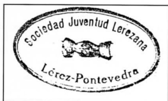
Selo de Juventud Lerezana

A revista CEDOFEITA xa publicou un par de artigos nos que se daba cumprida conta do proceso de recuperación para os veciños do local de Juventud Lerezana e tamén unha pequena aproximación á incautación do mesmo. Neste ano de 2008 no que se celebra o 75 aniversario da inauguración do local social, tentaremos completar a historia desta entidade tan significativa na nosa parroquia.