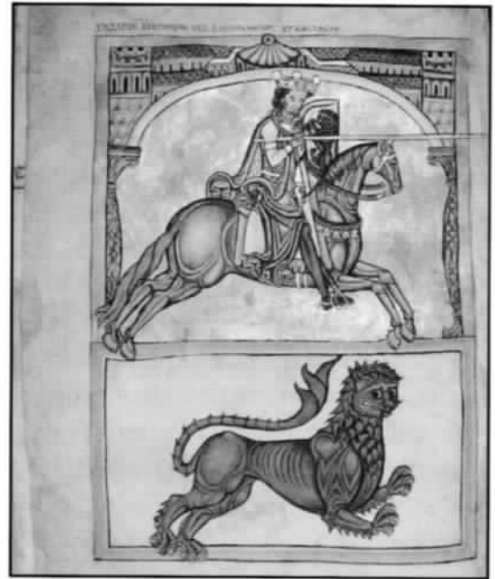
Alfonso IX. Tumbo A (Arquivo da catedral de Santiago) imaxe que acompaña a confirmación das posesións da mitra compostelá na que se inclúe Cedofeita.

polos en sendas marxes do río. Na doazón que fai o rei Alfonso IX, o fillo de Fernando II, á sede compostelán, apenas morto seu pai, queda clara a división pois especificase: “ Citofactum ” e “ burgum quod dicitur Ponteueeteri ” 11 .