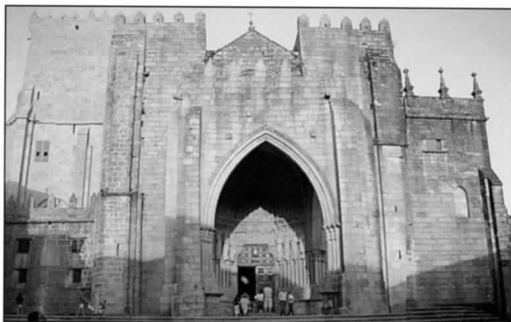
Catedral de Tui. O carácter defensivo que adquiriu nos séculos finais da Idade Media debeuse a importancia e fortalecemento do Miño como fronteira

Alfonso como prelado mindoniense, o arcebispo de Braga propuxo que a súa consagración se realizase en Tuy, en San Bartolomeu de Rebordáns. Era o lugar a medio camiño entre Compostela e Braga, pero a inestabilidade política, malia que Portugal e Galicia atopábanse entón baixo a mesma coroa, Tui non foi considerado por Xelmírez un lugar seguro. O Miño era atravesado a miúdo por tropas do alén do río, a diocese tudense estendíase ata o Limia, e algún prelado da sede provían de Braga, razóns que o levaron a considerar o Lérez como verdadeira fronteira. Logrou atraer o portugués ata o mosteiro pontevedrés. O arcebispo portugués fíxoo “para tratar máis detidamente con el da desaparición da discordia, do restablecemento da paz e da tranquilidade das igrexas” 7 . O autor da crónica narra como “unha vez celebrada a misa, o bispo da sede apostólica visitou unha finca súa, Guxilde, situada nunha amena paraxe do val xunto ó Lérez, e levou consigo o bispo de Ourense. E na igrexa de Lérez mandou que fosen atendidos cuidadosamente o arcebispo xunto con ámbolos bispos, elevados recentemente á dignidade do episcopado e a outros que apreciaba... naquel mesmo día, deliberando longo tempo, o arcebispo e o bispo de Santiago, trataron do pacto de paz, dos intereses das igrexas e o que pertencía á diocese de Ourense ou á de Tui, sobre o que tiñan desavenencias unha e outra sede” 8 .