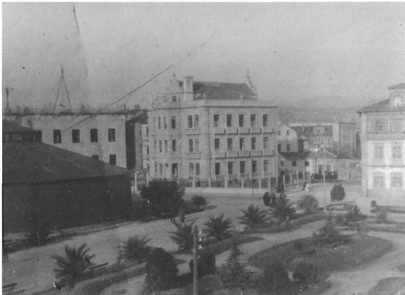
11. nº3. O teatro-circo nas Palmeiras, ó fondo o instituto Valle Inclán en construción.

A nova arte non da mostras de esgotamento, paseniñamente vai madurando por todas partes. As salas multiplícanse na Galiza. Aínda que os tempos e as modas cambian o negocio parece sólido, polo que continúa a ampliarse a oferta; no noso entorno en concreto cando en 1904 inaugúrase outro cinematógrafo nun local colindante co antigo "Café Moderno", así como temos noticias dunha sala en Marín e posiblemente outra en Placeres. Ata o café "Méndez Núñez" comeza a usarse ocasionalmente logo de 1916.